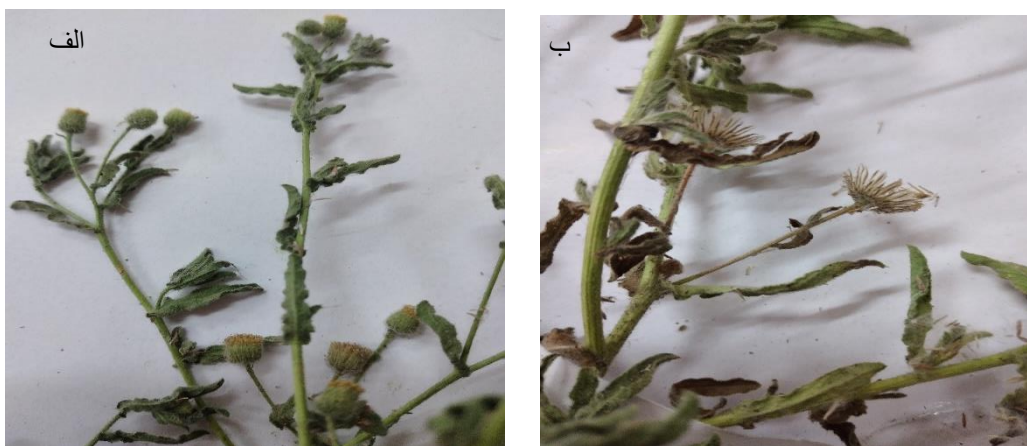
شکل ۱: الف) و ب) بخش هوایی گیاه Ditrichia graveolens

عطر پاییزی ( Ditrichia graveolens (L.) Greuter) گیاهی است دیر گل، علفی، یک ساله، با بویی کافور مانند، به ارتفاع تا (۱۰-) ۳۰-۸۰ سانتی‌متر، در بخش فوقانی با شاخه‌های فراوان، کاملاً پوشیده از کرک‌های غده‌ای پرزدار چسبناک و معطر مخلوط با کرک‌های بلند، فاقد غده. برگ‌ها خطی - سر نیزه‌ای باریک، انتهایی نوک دار یا نوک تیز. کپه‌ها متعدد. گل‌های کناری ۶-۷ میلی‌متر، ۸ - ۶ عدد، با زبانه‌ای کوتاه، گل‌های مرکزی به طول ۴ - ۳/۵ میلی‌متر، زرد رنگ، گاهی ارغوانی شونده. میوه کافشه‌ای، به طول ۲ تا ۳ میلی‌متر. جقه (کاکل) ریز، به طول ۵ - ۴ میلی‌متر، قهوه‌ای شونده، با تعداد تارهای حدود ۳۰ عدد (مظفریان، ۱۳۷۸). این گیاه در کنار جاده‌ها، زمین‌های بایر، خاک‌های مرطوب و تخریب شده و زمین‌های تحت شوری، رشد می‌کند. معمولاً در اواخر بهار یا در تابستان جوانه زده و در پاییز گل می‌دهد (شکل ۱).